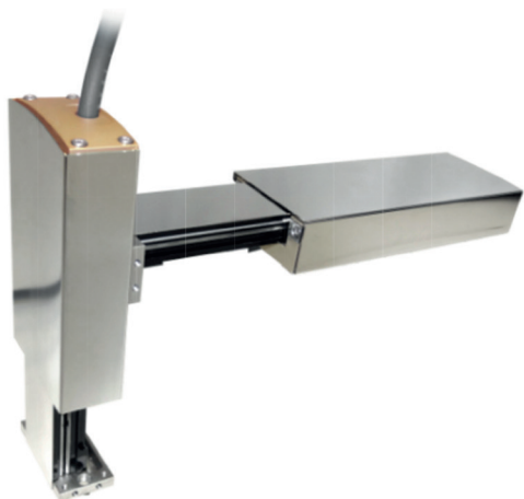
Ein weiteres Highlight: Der ELAX® Pick and Place, flach ausgerichtet mit Chromstahlabdeckung für die Lebensmittel- und Pharmaindustrie oder in Reinnräume.

Jenny Science AG Sandblatte 7a CH-6026 Rain Schweiz Tel: +41 41 455 44 55 Fax: +41 41 455 44 50 www.jennyscience.ch