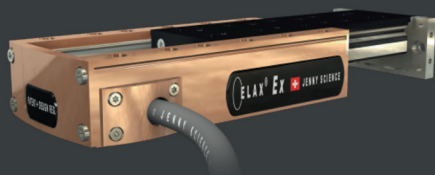
ELAX® Linearmotor Schlitten mit optionalem seitlichen Kabelabgang